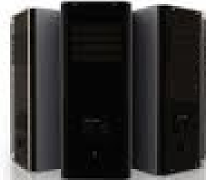
アイリストサーバー